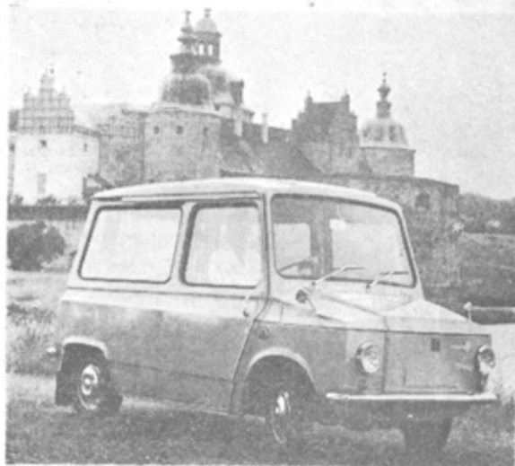
Den nya postbilen Tjorven ses här i sin födelsestad, Kalmar. Men den kommer att bli en vardaglig företeelse i Bjärebygden i framtiden.

— Vi har goda kontakter med myndigheter, de kommunalt engagerade och stora företag och vi diskutera den nya organisationen med