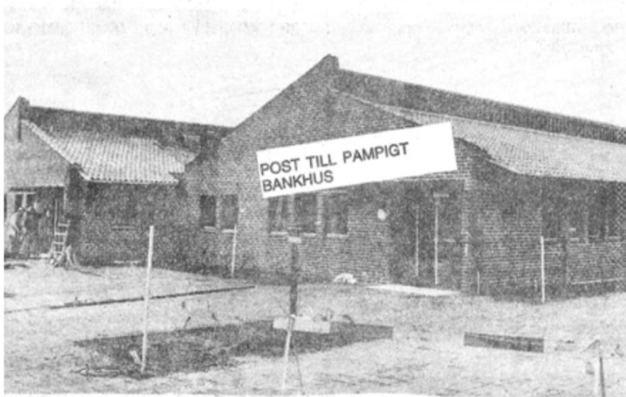
Båstadposten får skräddarsytt inom de nya domänerna nere i Båstads allt ökande centrum: Vångavägen-ridhemsvägen. Posten infogas mellan husgrannarna Polis och Försäkringskassa. Postskylden väntar på sig - blir på fristående stativ vid entrén.

Båstads post är på femte stället under loppet av drygt 150 år. Utvecklingens krav har måst följas. Efter invigningen 5 december skall bli intressant att kunna redovisa Båstads post av modell 1977. Rundvandring i de nya lokalerna är utlovad. Båstads postställen under de 150 åren har själva gjort något av "rundgång" i samhället. Nu (för gott?) i Båstads nya centrum. Framtid och samhällsplanering får utvisa om så skall bli. Men än kan man inte kalla Båstads post för någon "hopp-gerka".