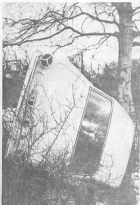
Detta var början till slutet för de båda postmästarna. I en kurva i Spannarp sladdade bilen av vägen och hamnade fastklämd mellan ett träd och vägläntan.

— Vi inom Postverket är mycket angelägna om att något givs åt det här, understryker postmästare Sven E. Broman.