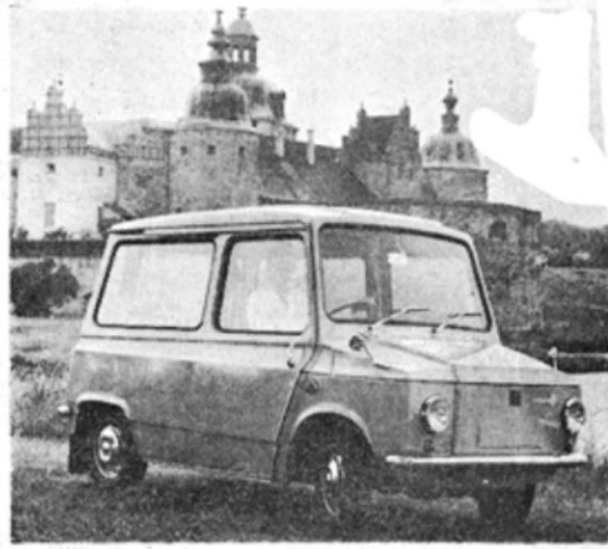
Den nya postbilen Tjorven ses här i sin födelsestad, Kalmar. Men den kommer att bli en vardaglig företeelse i Bjärebygden i framtiden.

— Vi har goda kontakter med myndigheter, de kommunalt engagerade och stora företag och vi diskuterar den nya organisationen med